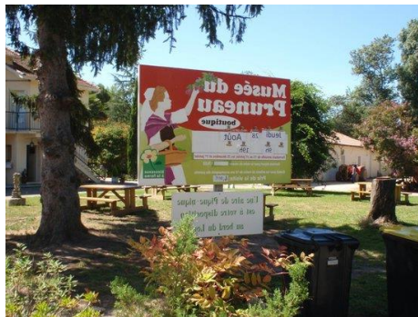
Musée des Pruneaux