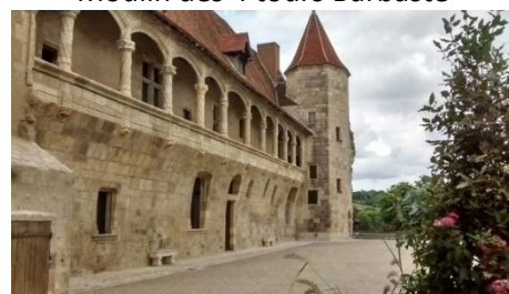
Musée Henry IV Nerac