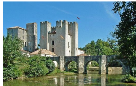
Moulin des 4 tours Barbaste